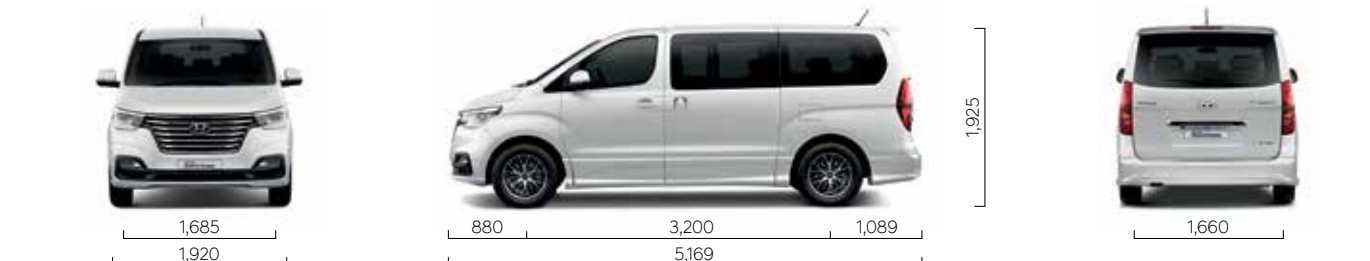
หน่วย: มิลลิเมตร