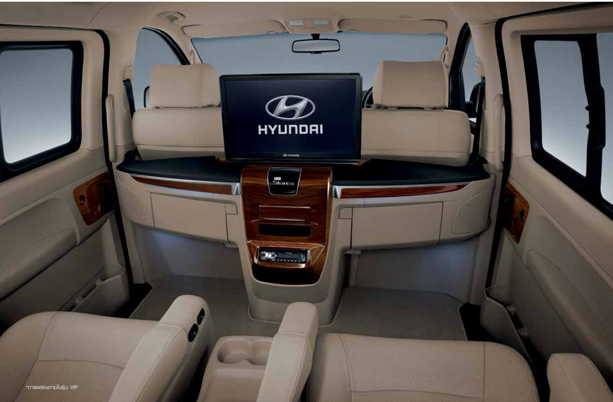
ภาพแสดงภายในรุ่น VIP