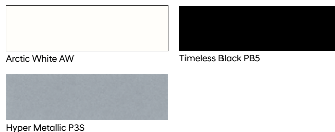
Hyper Metallic P3S