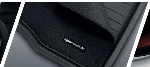
ชุดพรมพร้อมพ้ายางปูพื้น โลโก้ Sportech-X ใหม่