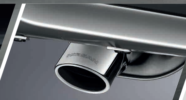
ปลายท่อไอเสียแบบโครเมียม เป็นความสปอร์ต