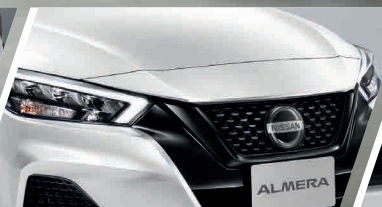
กระจังหน้าใหม่ สีดำเงา มาพร้อม ไฟส่องสว่างเวลากลางวัน