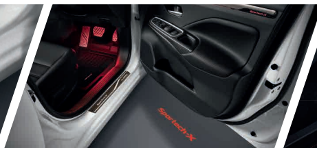
เอ็กซ์คลูซีฟขั้นสุดด้วย อุปกรณ์ตกแต่งพิเศษ Ambient Light ใหม่