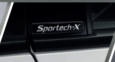
พิเศษอีกชั้นด้วย โลโก้ Sportech-X ที่ข้างประตู