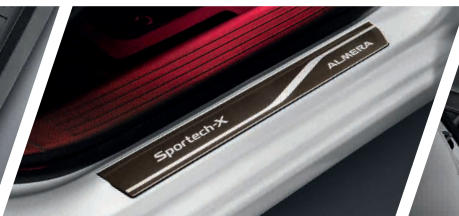
ชุดคิ้วบันไดสแตนเลส พร้อมโลโก้ Sportech-X ใหม่