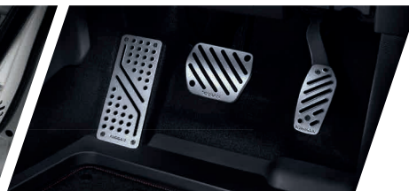
เพิ่มความมั่นใจ ด้วยเป็นวงแหวนเกากรงสปอร์ต