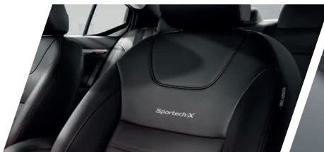
ภายในตกแต่งสีดำแดงด้วยสีเบอร์กันดี พร้อมโลโก้ Sportech-X ใหม่