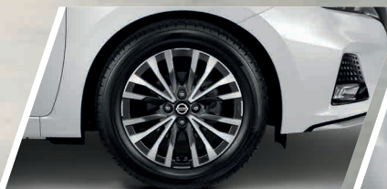
ล้ออัลลอยใหม่ 16" สีดำปิดเงา