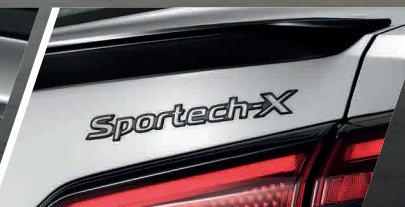
โลโก้ Sportech-X พิเศษ เฉพาะรุ่นนี้เท่านั้น